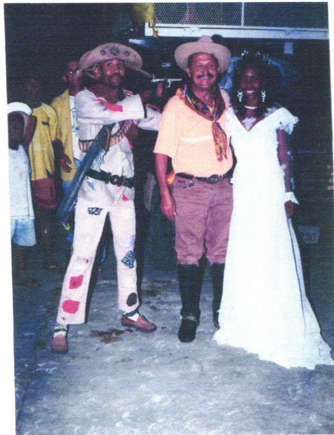
O próprio Bigode ameaçado, pelo pai da noiva, de revolver, em punho: "ou casa ou morre".