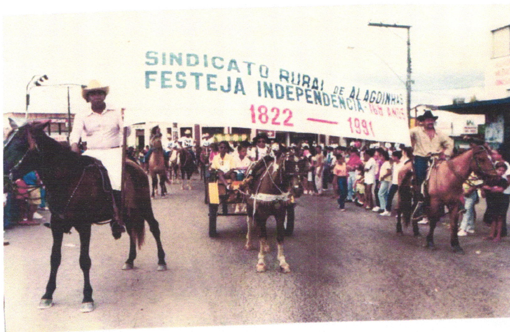
Foto do Sindicato Rural, em 1991. O Sindicato sempre foi um parceiro do Casamento Matuto. A charrete da foto, participa do desfile do 7 de Setembro, como os cavaleiros e amazonas que também servem de convidados para o casamento.