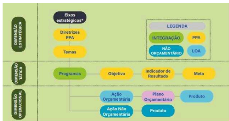
Figura 1: Modelo Referência do PPA Federal

Tais inovações estão voltadas para o resgate da função planejamento, para a utilização de uma linguagem capaz de melhorar a comunicação dentro e fora do Governo e para o fortalecimento da dimensão estratégica do Plano, criando as condições necessárias para a gestão e implementação das políticas públicas na perspectiva municipal.